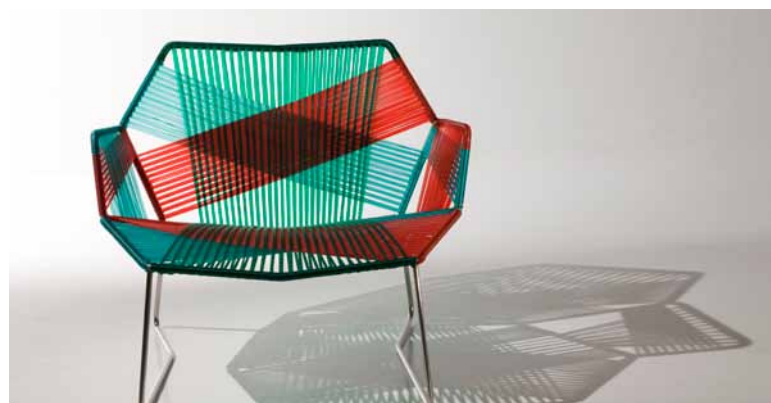
Tropicallia für Moroso

Mein Design ist nicht spektakulär. Die Menschen sehen sich meine Möbel, Waschtische oder Armaturen an und sollen denken: „Damit bereichere ich mein Leben! Das sind wirklich gute und praktische Objekte, die Form und