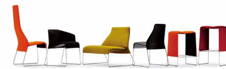
Lazy 05 für B&B Italia