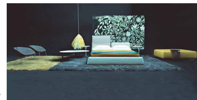
Highlands für Moroso

Ich denke, es geschieht in gleicher Weise wie bei der Küche. Nicht mehr ein isolierter, separater Bereich, sondern offen für andere Funktionen und Möglichkeiten der Nutzung. Ein Badezimmer ohne Wände, die Öffnung hin zum Schlafzimmer oder dem begehbaren Kleiderschrank. Ein ver-