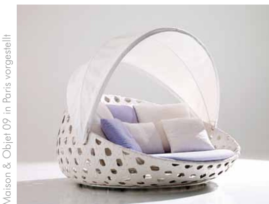
Neues Canasta Sofa mit Sonnendach & Rollen für B&B Italia - wird auf der Maison & Objet 09 in Paris vorgestellt