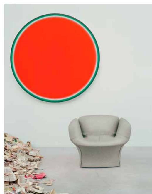
Bloomy für Moroso