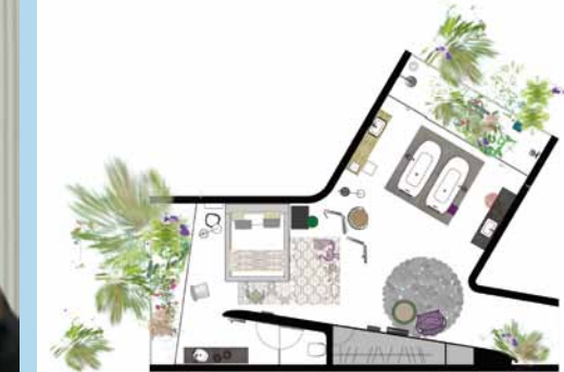
Patricia Urquiola's Traumbad in Y-Form