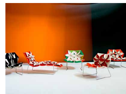
Antibodi für Moroso